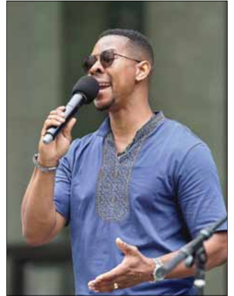
Американський співак Джуда Бріджес.