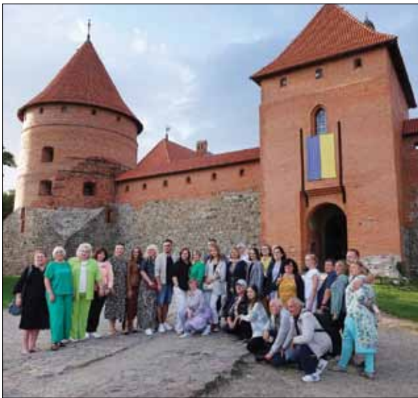
Учасники конференції в місті Тракай.

Представники закладів вищої освіти, академічних і дипломатичних інституцій, громадських організацій України (Києва, Полтави, Чернівців, Луцька, Вінниці, Кропивницького, Маріуполя, Переяслава, Івано-Франківська) і Литви (Вільнюса, Каунаса, Клайпеди, Анікщяю) працювали у чоти-