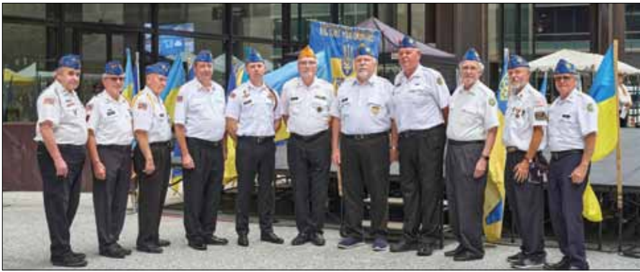
Українські американські ветерани