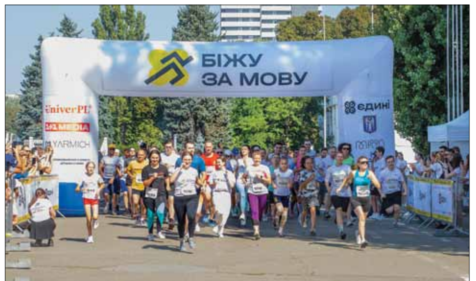
Забіг „Біжу за мову“ зібрав близько 500 учасників у Києві та інших містах України.

КИЇВ. – 18 серпня забіг „Біжу за мову“ зібрав близько 500 учасників у Києві та інших містах України і світу, зокрема в Ужгороді, Львові, Івано-Франківську, Відні та Нью-Йорку. Про це йдеться у дописі Уповноваженого із захисту державної мови Тараса Кремня, який і представники секретаріату мовного уповноваженого також взяли участь у забігу, який до Дня Незалежності України організує всеукраїнський рух „Єдині“. Забіг організований на підтримку українців, які перебувають на тимчасово захоплених Актіа „Біжу за мову“ триватиме по 24 серпня. Кожен охочий