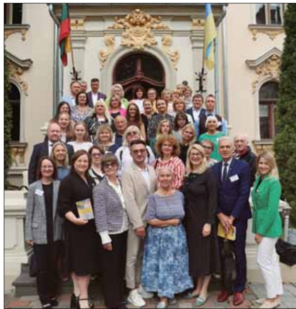
Учасники міжнародної науково-практичної конференції у Вільнюсі