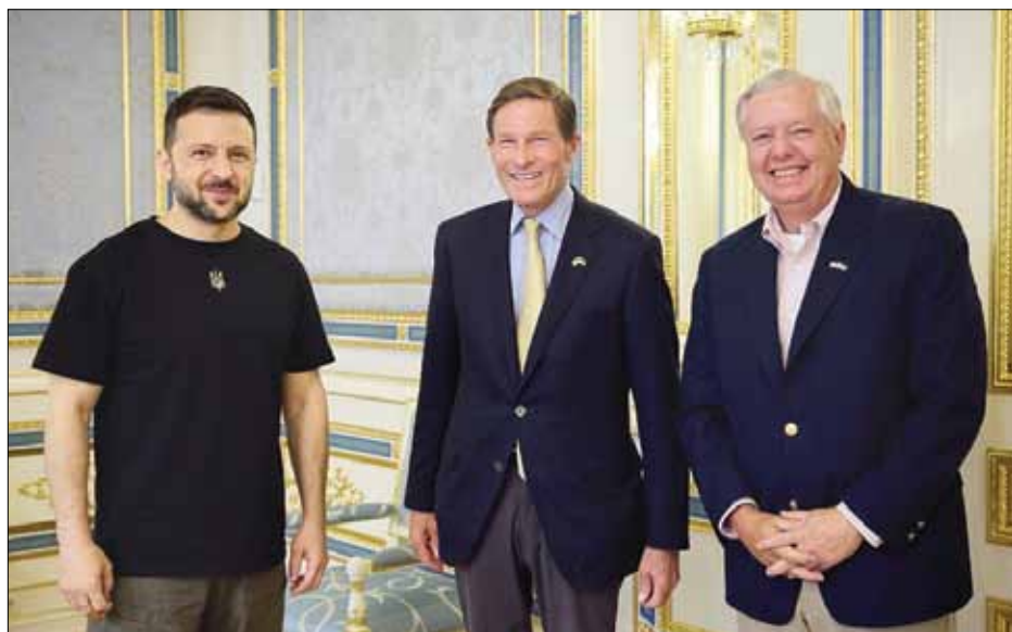
Зліва: Президент Володимир Зеленський та сенатори Річард Блюменталь та Ліндсі Грем.

КИЇВ. – Президент Володимир Зеленський 12 серпня провів зустріч із делегацією Конгресу США у складі сенаторів Ліндсі Грема (Р. - Півд. Кар.) та Річарда Блюментала (Д. - Конн), які перебували з візитою в Україні. Глава держави відзначив, що чергова візита двопартійної делегації Конгресу свідчить про незмінну під-