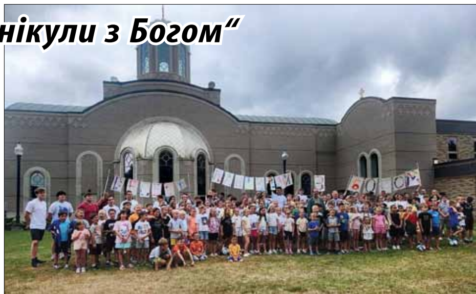
Табір „Веселі канікули з Богом”.