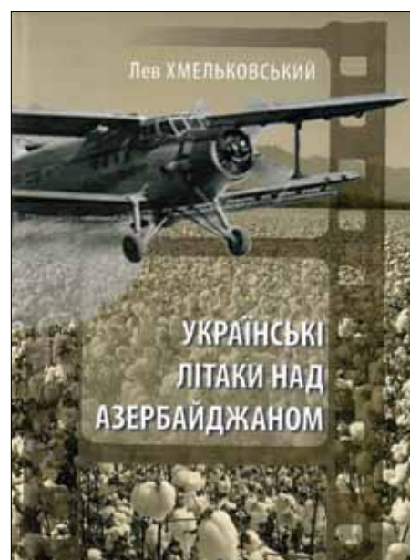
Книжка „Українські літаки над Азербайджаном“.

А в КБ Антонова після пристосування виробничих потужностей на