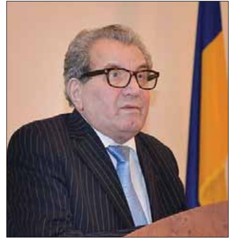
Св. п. проф. Степан Гелей

В 1985 році він створив в університеті хорову капелю "Мрія" і з того часу був незмінним президентом колективу, який виступав в багатьох містах України і 13 державах Європи. "Мрія" стала лавреатом багатьох міжнародних конкурсів, її вітали слухачі Молдови, Англії, Франції, Німеччини, Італії, Іспанії, Польщі, Чехії, Голяндії, Швейцарії, Ватикану,