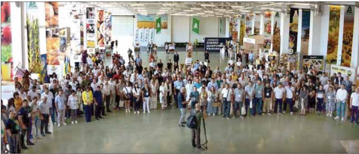
Під час форуму в Кропивницькому.