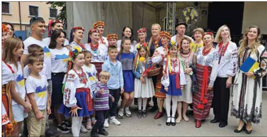
Учасники „Українського стенду“.

„Цьогоріч до червневого свята ми почали готуватися з лютого, – додає Ю. Репецька. – Наша сила – люди, без-