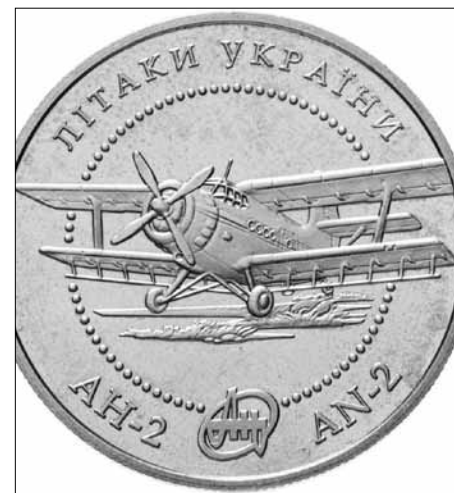
Монета України на честь Ан-2.