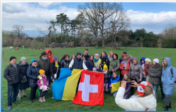
Зустріч українців у Женеві та Лозанні