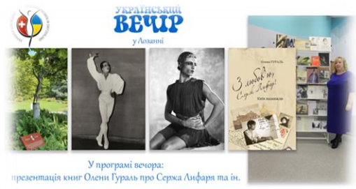
У програмі вечора: презентація книг Олени Гураль про Сержа Лифаря та ін.

https://www.facebook.com/groups/757782467969061/permalink/1261275827619720/