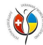
Зустріч українців у Женеві та Лозанні